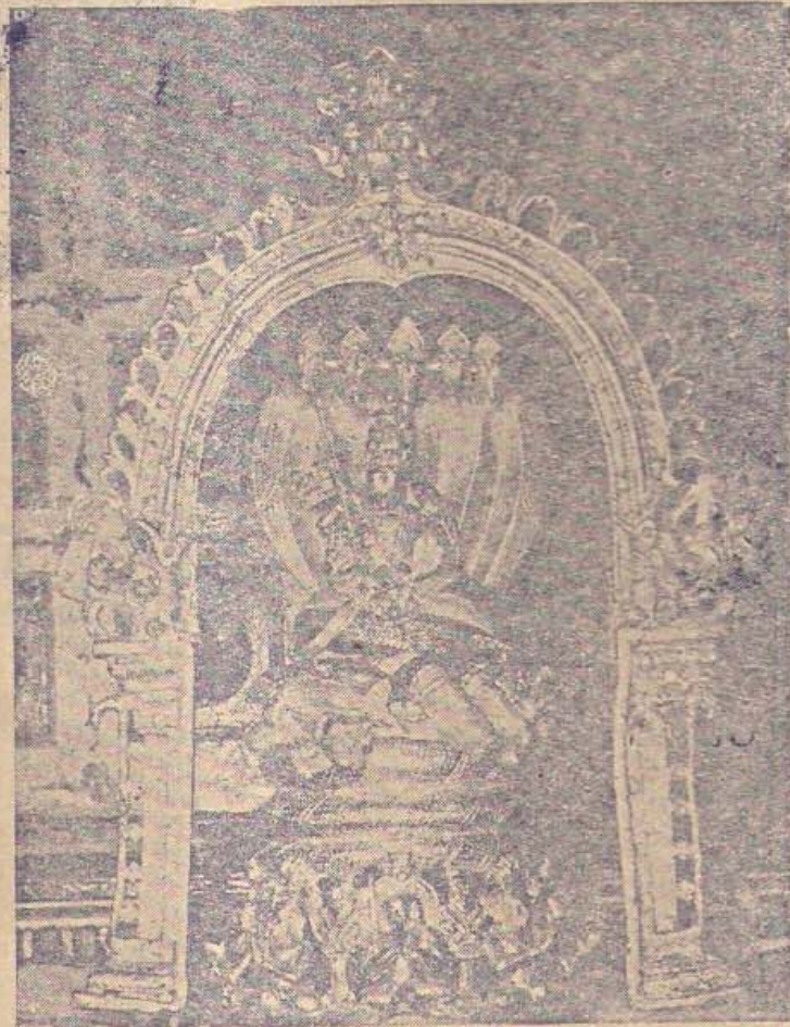
கோயில் மணவாள மாமுனிகள்